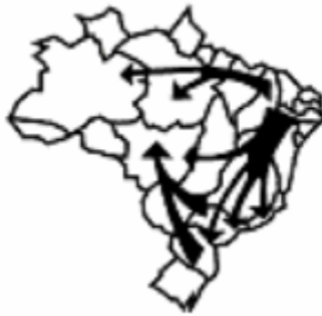
Décadas de 60 e de 70