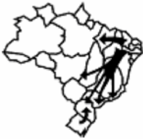
Décadas de 50 e de 60