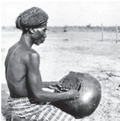
Fotografia em preto e branco de músico da cultura lupa (norte de Angola) tocando uma kalimba ou lamelofone.