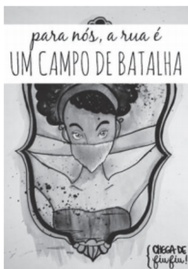
Disponível em: www.bhaz.com.br . Acesso em: 14 jun. 2018.

Essa campanha de conscientização sobre o assédio sofrido pelas mulheres nas ruas constrói-se pela combinação da linguagem verbal e não verbal. A imagem da mulher com o nariz e a boca cobertos por um lenço é a representação não verbal do(a)