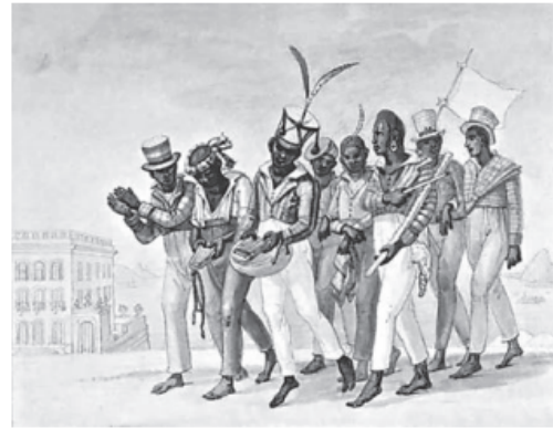
Manifestação carnavalesca registrada por Debret (1826): escravos vestidos como europeus, em cortejo musical, à época do Império.

DEBRET, J.-B. Disponível em: http://koyre.ehess.fr . Acesso em: 18 ago. 2017.