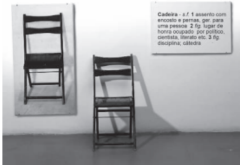
KOSUTH, J. One and Three Chairs . Museu Reina Sofia, Espanha, 1965. Disponível em: www.museoreinasofia.es . Acesso em: 4 jun. 2018 (adaptado).

A obra de Joseph Kosuth data de 1965 e se constitui por uma fotografia de cadeira, uma cadeira exposta e um quadro com o verbete “Cadeira”. Trata-se de um exemplo de arte conceitual que revela o paradoxo entre verdade e imitação, já que a arte